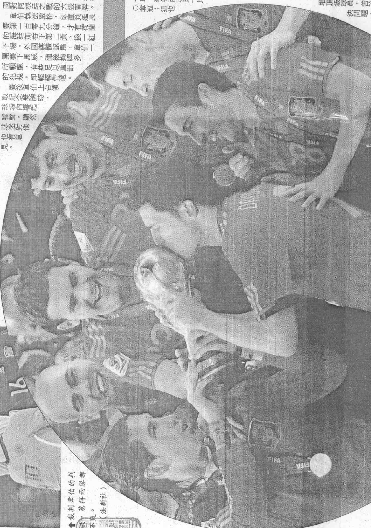
堆頂級球員，善於解決問題