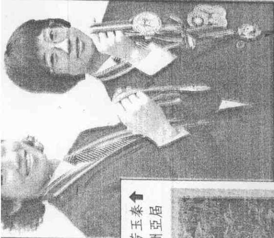
第七著拿同一鳳君陳與(右)芳玉秦 。牌金的得贏戰奮賽標錦洲亞屆