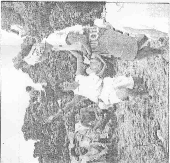
↑巾，勁強力腳 。眉鬚讓不懶 ↓戲遊郊學同和鳳君陳 。捏扭不絕候時的方大該