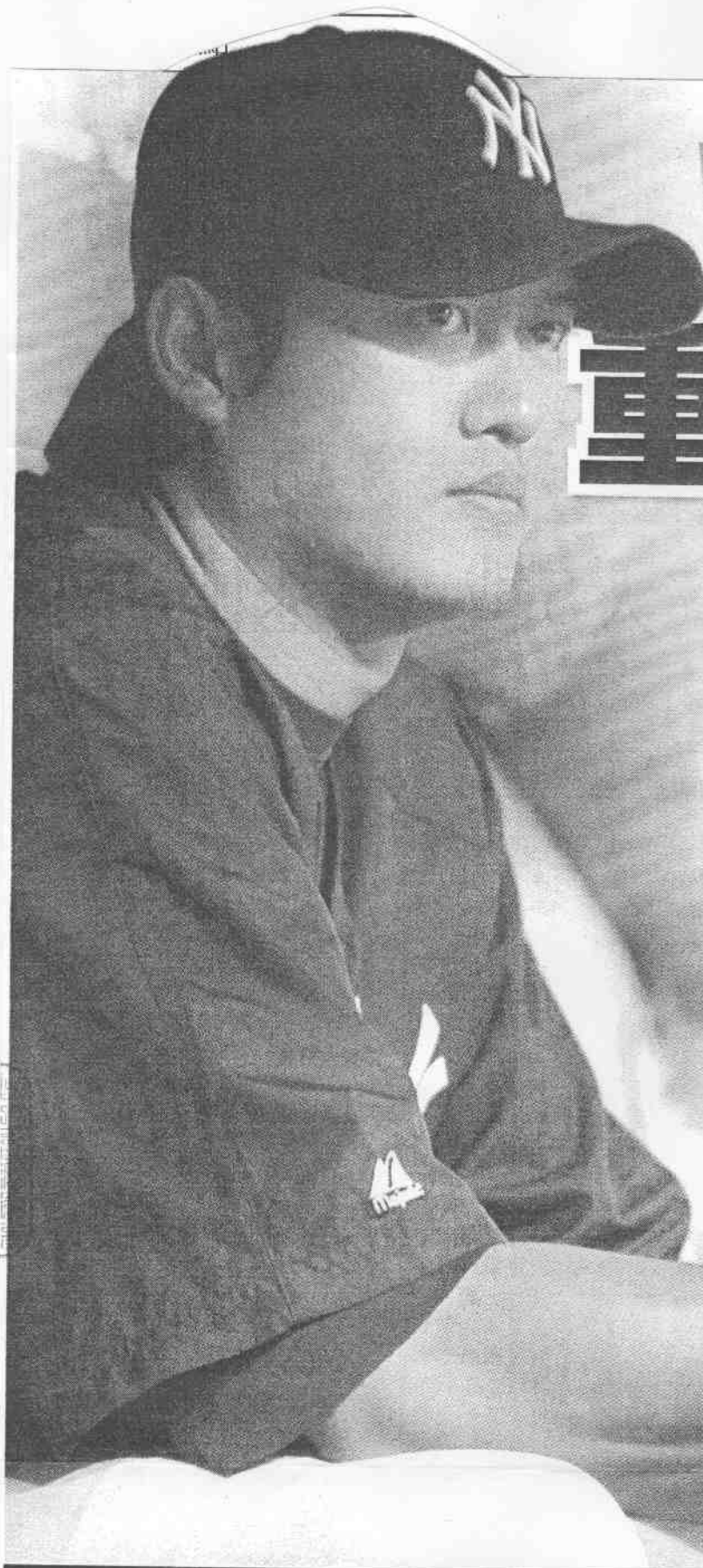
洋基昨天公佈季後賽先發輪值，王建民確定將在首戰先發，對手將是印地安人王牌沙巴西亞。