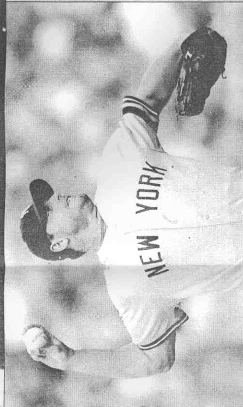
◀七屆賽揚獎得主、「火前鋒」克萊門斯在米契爾禁藥報告中列名，震撼大聯盟。