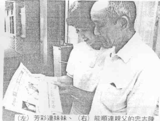
(左) 芳彩連妹妹、(右) 能順連親父的忠志陳 忠志陳關有報本讀閱場球夫爾高口林在午上天昨