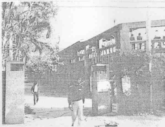
場；圖中是唯一的門，五、六千位觀眾及球員都是從這裏進出；圖下是球員不願待在悶熱的休息區，寧可在地上坐。

性際國的模規大更、多更辦舉畫計的勃勃致興正士人中台 。心擔人今在在，修失久年的場球棒，而然，賽比球棒