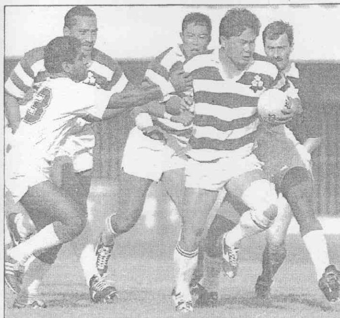
↑日本隊今天與中華隊爭亞洲橄欖球賽分組冠軍，日本隊球員體格魁梧，中華隊將加緊防備。