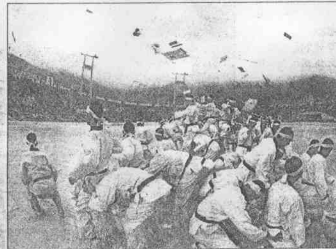
◆跆拳道是韓國國技，開幕典禮安排高手表演擊破技術。