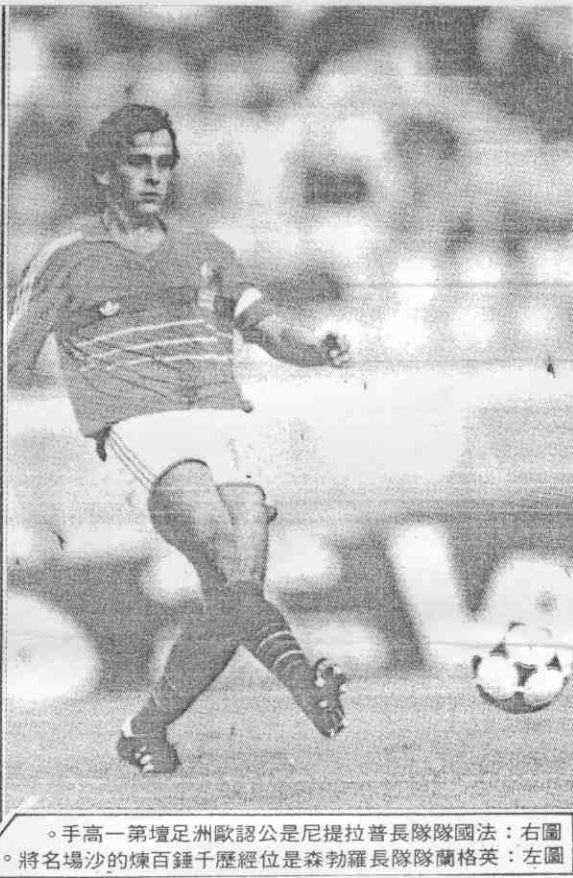
。手高一第壇足洲歐認公是尼提拉普長隊隊國法：右圖。將名場沙的煉百鍾千歷經位是森勃羅長隊隊蘭格英：左圖