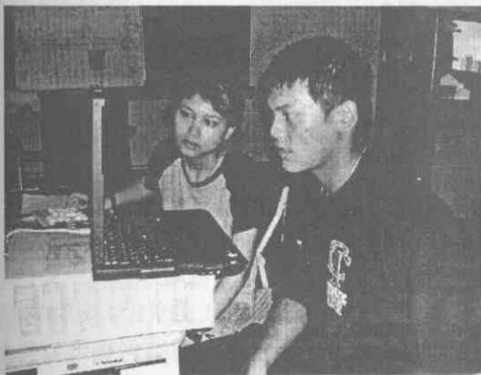
圖一 動體視力測試

動體視力測試是以日本運動視覺權威：Hisao Ishigaki 所開發出的專業運動視覺測試軟體 "Athlevision"，可分別測試個體能辨識向右(DVA-R)、向左(DVA-L)、向下(DVA-D)、向上(DVA-U)快速移動的數字之動體視力辨識能力。本研究為避免太陽光線影響測試電腦螢幕的亮度與出現反光，而影響受試者的辨識，所以實驗期間均將測試電腦架設於有窗簾之室內教室或空間之內；依照測試軟體所規範的距離，令受試者的雙眼距離電腦螢幕 15.8 英吋（如圖一所示）。測試的過程中，允許受試者配戴眼鏡或隱形眼鏡，但受試者的身體與頭部均不能移動。所有受試者均經研究者以運動視覺測試軟體所設定之測試方法與流程解說書面，進行詳細解說之後，每位受試者在四種動體視力測試之前均有三次的練習，以使受試者熟悉整個實驗儀器和測驗流程。正式測試時，研究者於開始測試前一秒說“預備”，使受試者專心注視電腦，電腦顯示二半圓，中間的軌道會出現一個數字，此數字會依不同速度移動，在移動的過程中會變換三個數字，受試者必需辨識所出現的三個數字為何；不論受試者的答案是否正確，研究者均不告知正確的數字，以避免產生學習效果及影響受試者心理狀態；每結束一個方向的測試後，會給予受試者休息與準備時間。所有的受試者均進行相同的測試流程與方法。