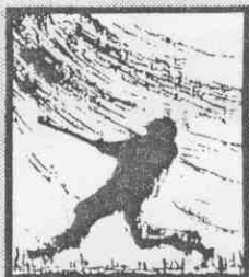
第3屆會長盃 棒球錦標賽