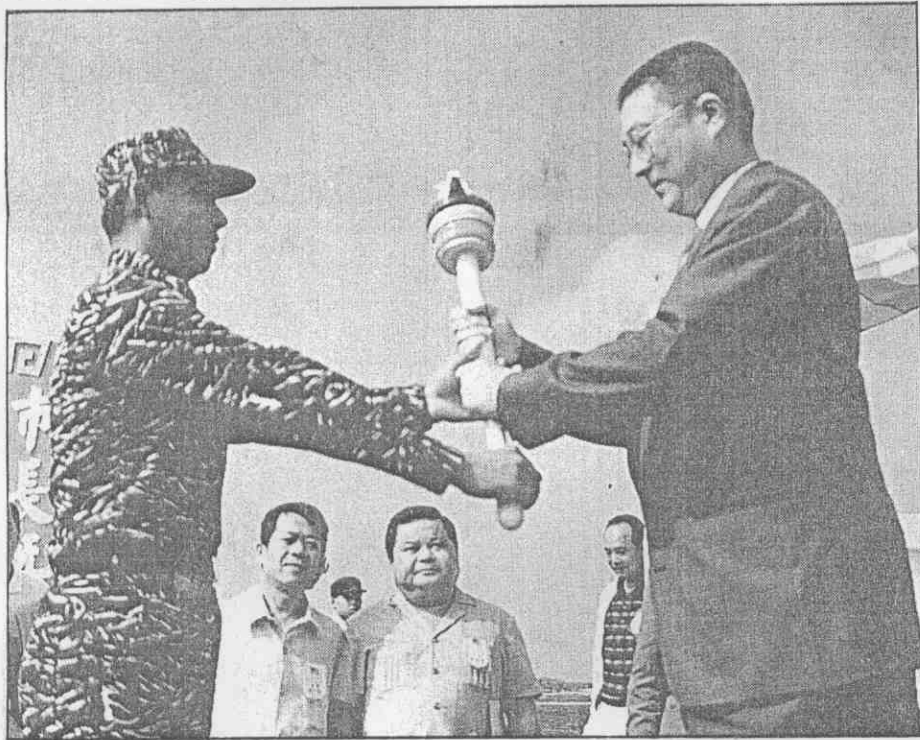
↑ → 區運聖火昨傳遞到東沙群島，由高雄市長吳敦義(上圖右)，轉交指揮官；再由駐軍傳遞至島上各據點。