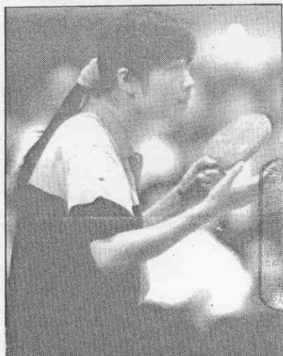
↑1988年奧運桌球金牌得主陳靜，左手刀板發球，神情專注。