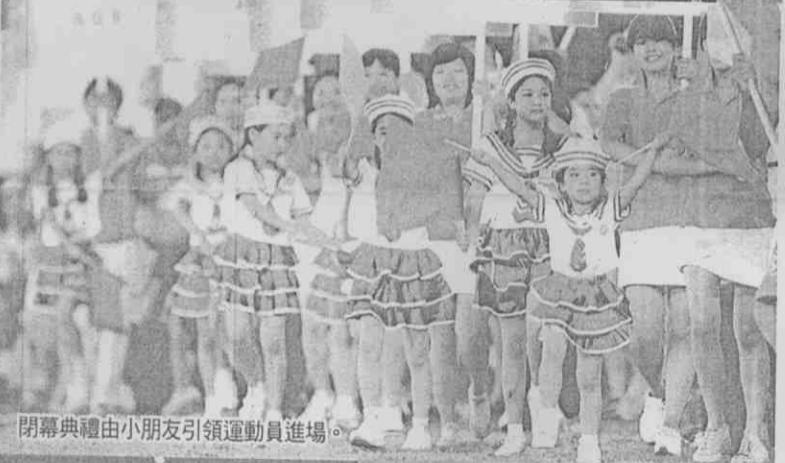
閉幕典禮由小朋友引領運動員進場。