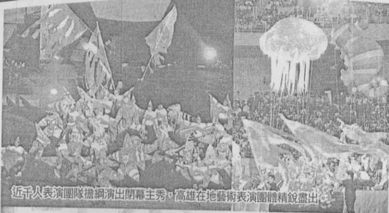
近千名表演團隊擔綱演出閉幕主秀，高雄在地藝術表演團體精銳盡出。