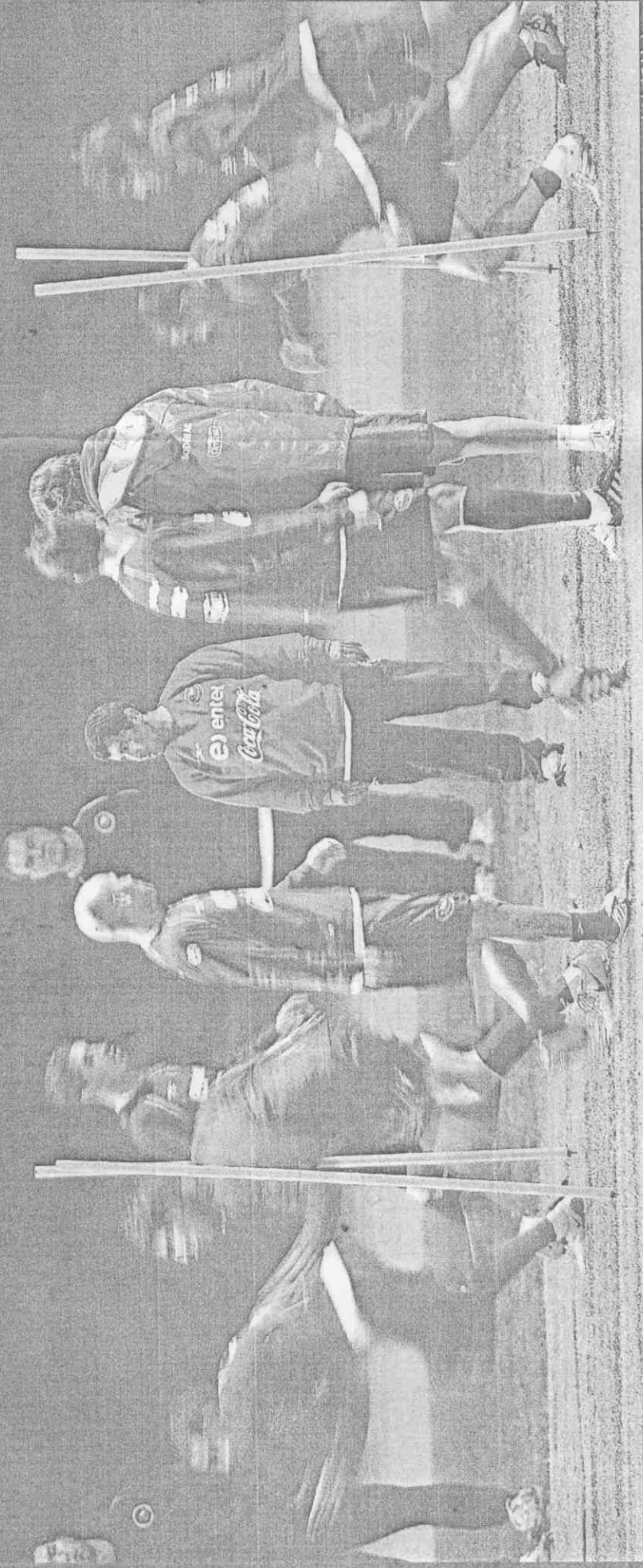
智利隊將在16強賽對決「森巴軍團」巴西隊，智利球員賣力練球，希望明天踢出奇蹟。

【記者馬鈺龍／綜合外電報導】敢和奪冠熱門西班牙隊玩對攻的，只有智利隊總教練貝爾薩，16強賽碰上巴西隊，流著律師遺傳血統的貝爾薩準備要再「堅持」一次。