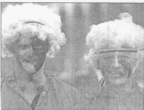
←比利時26日迎戰英格蘭前夕，扮相怪異的比利時球迷出現在雷納多聖壇運動場看台上。