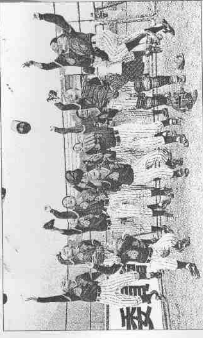
▲本報記者拍攝的關懷杯少棒賽球員，是我國有史以來第一個登上鈔票的運動圖案。