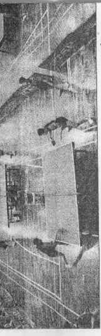
▲不僅桌球賽的場面如此盛大，所有民生杯都熱鬧驚人。

細訴不盡的無數值得記取的時刻，烙入許多人的共同記憶；民生報，一直是和體育運動愛好者肩搭著肩的好朋友，曾經，我們一直站在同一陣線上，舉手，高呼。