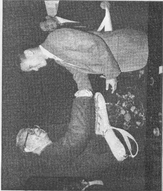
▲張德培(右)震驚世界網壇的贏得法國公開賽冠軍後，特地把他的奪標金拍送給他愛護有加的王爺。

民生報也是國內體壇非常重要的人才培育搖籃。從早期的「飛躍羚羊」紀政到晚期的「風速女王」王惠珍，乃至國際網壇名將張德培、中華網球女將王惠婷、美國華裔滑冰好手「捕夢娃娃」陳婷婷，都是民生報長期支持、聯合報系實質贊助的傑出運動員。