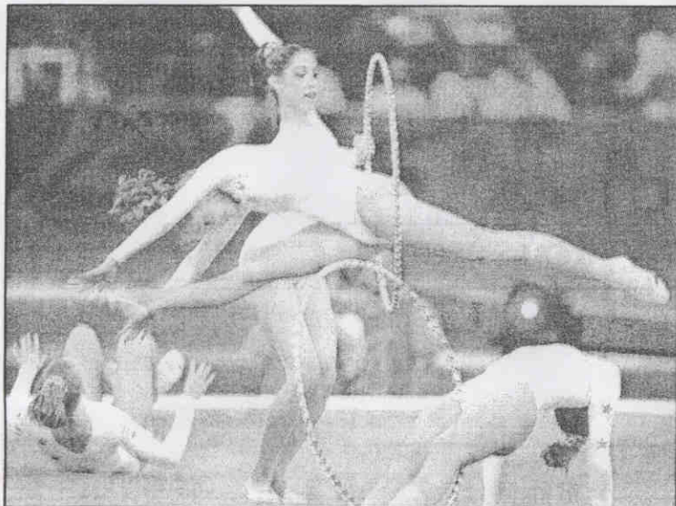
花環 ▲美國韻律體操隊在奧運體操秀，演出環團體舞的精采畫面。

兩個小時的精采表演，再配上亮麗、五彩燈光、美妙及震撼人心的音樂，使得觀眾看得陶醉過癮，遠勝主戲體操比賽。