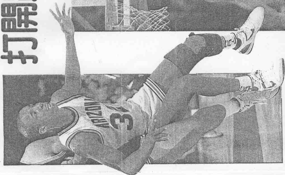
力主學大納桑利亞——第一名排美全。特略艾鋒前