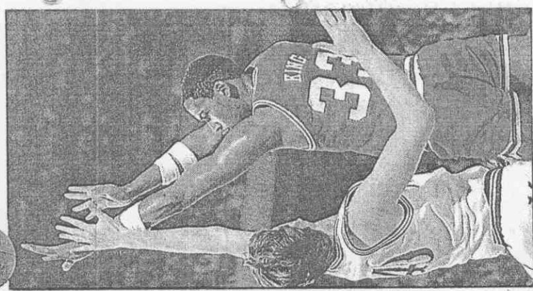
荷拉克奧二第名排是(右)恩金。力主分得及鋒中學大馬

以預測。不過，在NCAA錦標賽中，有明星球員在傳的學校，穩定性通常都較高。一般認為在東區比賽中，喬治城大學(二十六勝四敗)與杜克大學(二十四勝七敗)是兩大熱門，東南區以奧克拉荷馬大學(二十八勝五敗)及北卡羅萊納大學(二十七勝七敗)較被看好，中西區以伊利諾大學(二十七勝四敗)與密蘇里大學(二十七勝七敗)的勝算較高，西區以亞利桑納大學(二十七勝三敗)與印