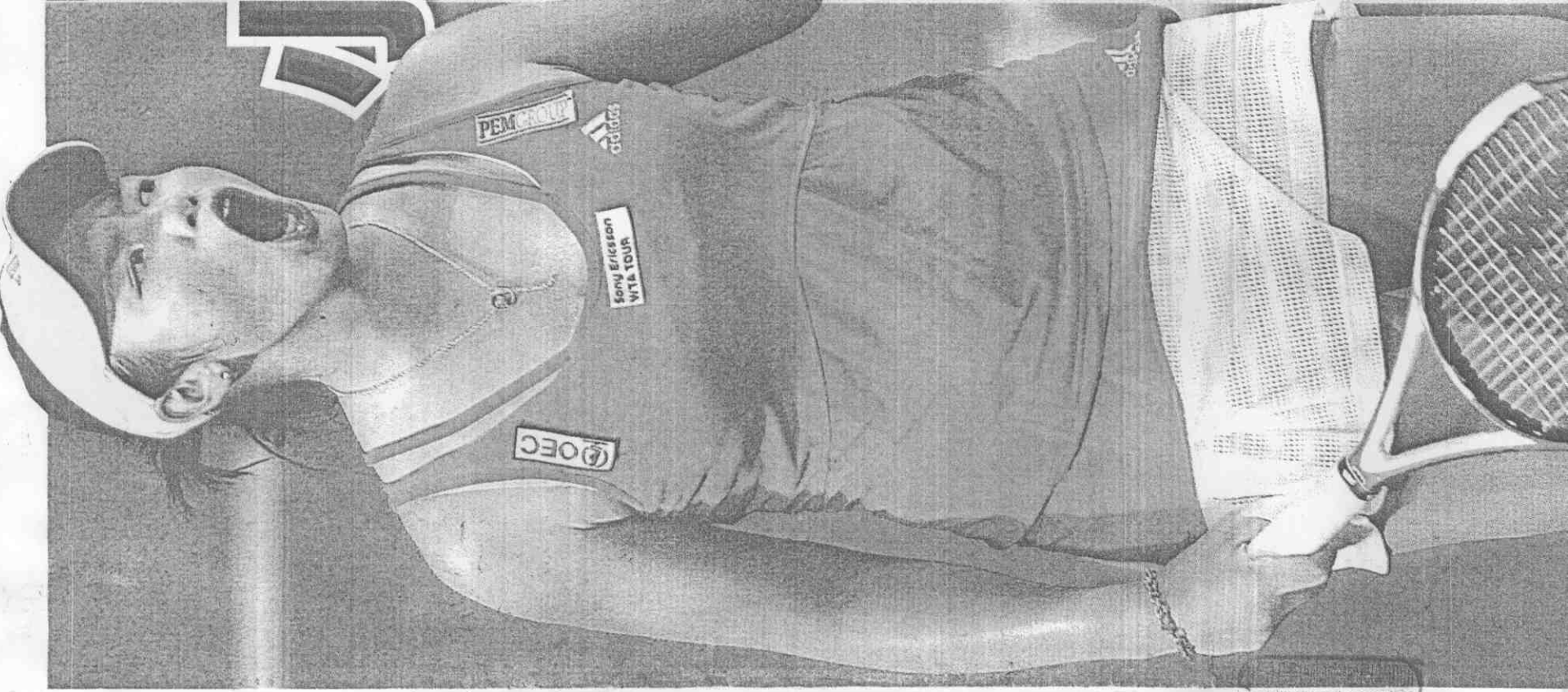
史特拉斯堡女網賽