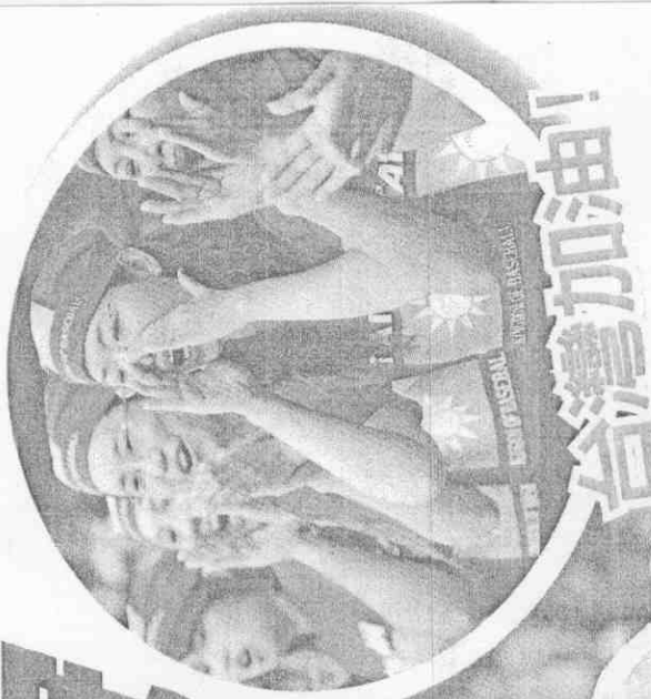
台灣球迷在場邊高喊，為中華少棒隊加油。