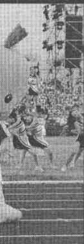
會專屬啦啦隊表