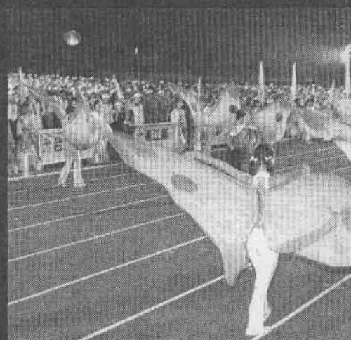
↑全運開幕式的蝴蝶仙子表演，代表雲(記者)