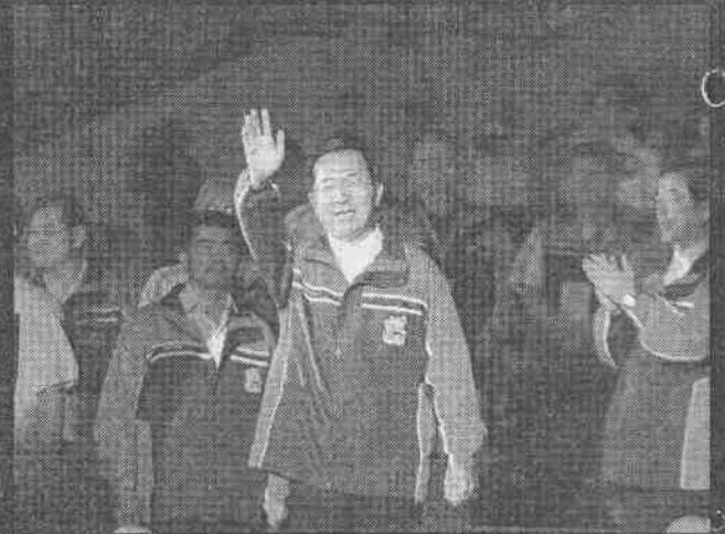
↑陳水扁總統蒞臨全運會開幕式，向群眾揮手致意