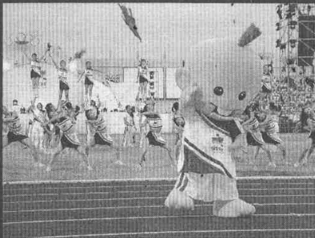
↑大會吉祥物布袋戲哈麥二齒與大會專屬啦啦隊表演，帶動開幕式熱場，觀眾掌聲不斷。