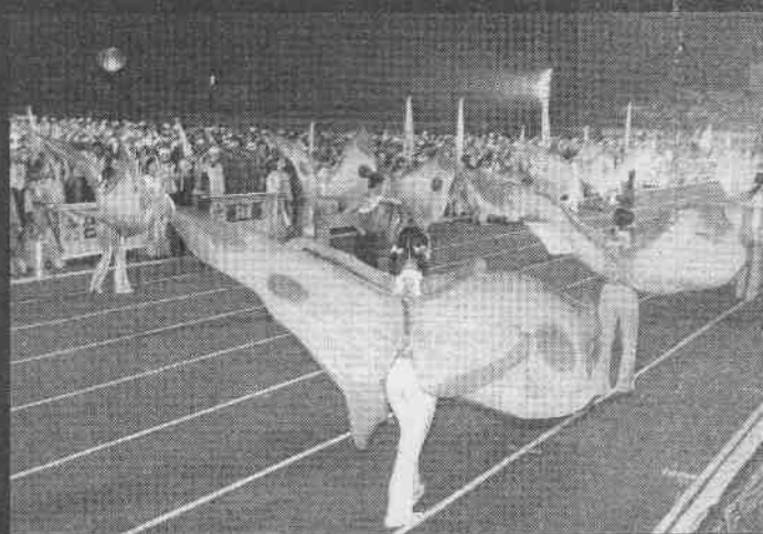
↑全運開幕式的蝴蝶仙子表演，代表雲林起飛