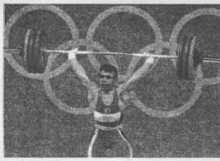
↑舉重「小巨人」穆特魯體重僅 55 公斤，卻能舉起相當於自己體重 3 倍的重量。

3 連霸 舉重王朝無匹 這個疑問在賽後記者會中有了答案，這位舉重神童完成 3 連霸之後，顯然不願輕易退休，「舉重是我的最愛，跟我的生命一樣重要，即便再苦、再累，或是到了 40 歲，也還能舉出好成績」。 穆特魯在 2002 年曾經接受右肩肌腱斷裂手術，翌年傷後復出，首度挑戰 62 公