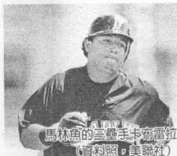
馬林魚的三壘手卡布雷拉