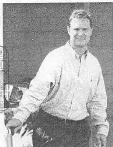
失望，但馬丁利不生氣，反而感謝洋基給他面試的機會。