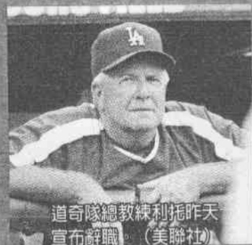
道奇隊總教練利托昨天宣布辭職。