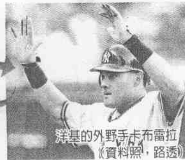
洋基的外野手卡布雷拉