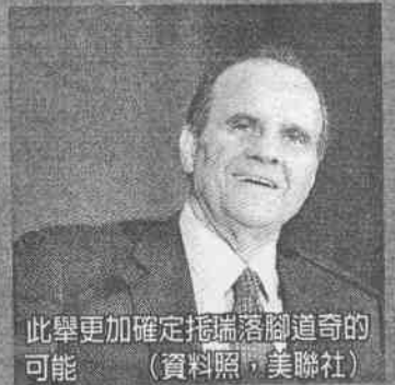
此舉更加確定托瑞落腳道奇的可能

先被追平後，最後更在延長賽第11局遭洋基敲出全壘打而被逆轉，利托也因此丟掉烏紗帽。