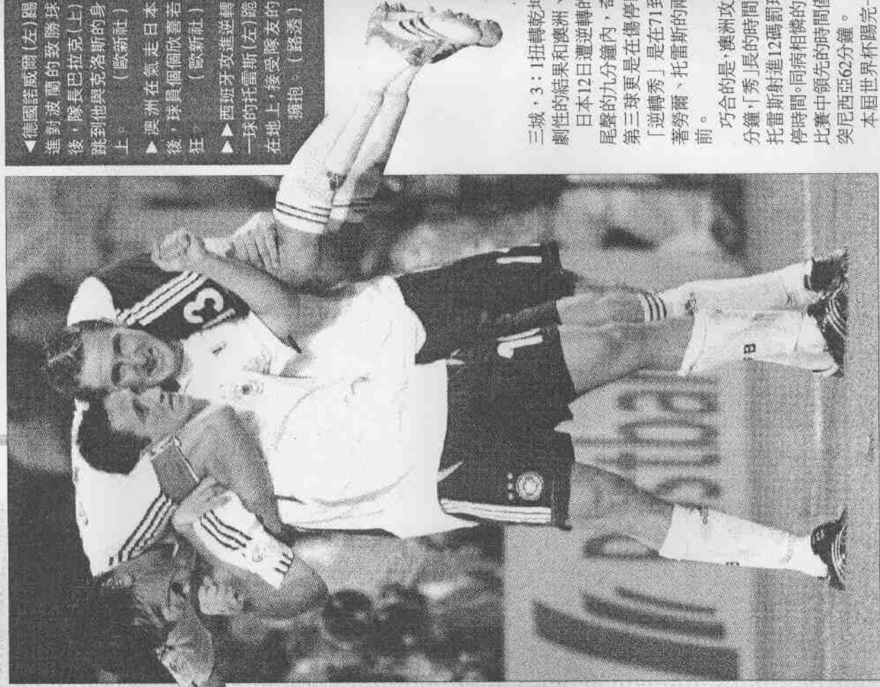
◀德國諾威爾(左)踢進對波蘭的致勝球後，隊長巴拉克(上)跳到他與克羅斯的身上。(歐新社) ▶澳洲在氣走日本後，球員個個欣喜若狂。(歐新社) ▶西班牙攻進逆轉一球的托雷斯(左)跪在地上，接受隊友的擁抱。(路透社)