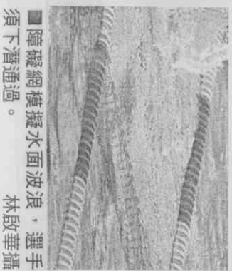
障礙網模擬水面波浪，選手須下潛通過。