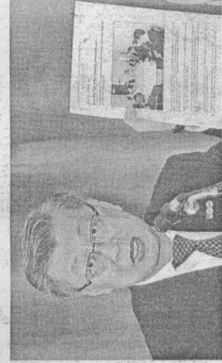
■行政院副院長陳冲昨開記者會說，不惜向國際體育仲裁法庭提告。