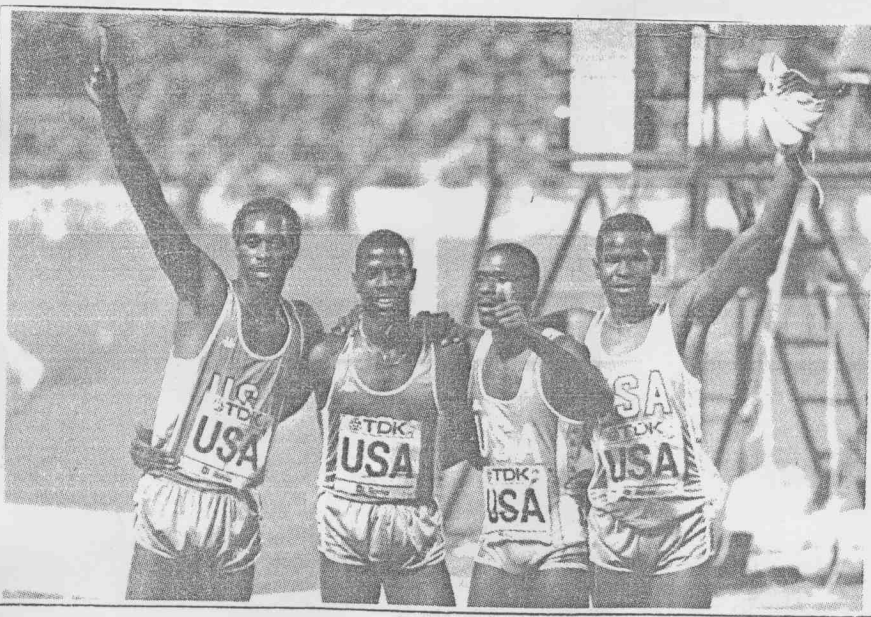
▲世界田徑賽男子四百公尺接力，美國隊勇奪冠軍，興奮地做出「我們第一」的手勢。