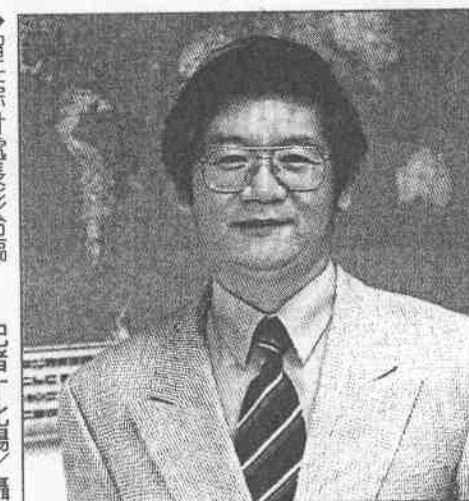
→ 留任綜計處處長彭台臨