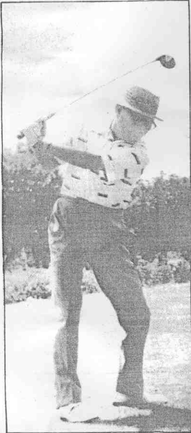
▲周至柔將軍生前酷愛高爾夫。

近二十年來，我國高爾夫男、女職業、業餘球員，在周將軍的培植之下，屢次在國際賽名列前茅，為國家爭得極其輝煌的榮譽。目前揚名國際的陳志忠，也正是在周將軍精神鼓勵與經濟贊助下，勇敢赴美打天下，將我國高爾夫戰場，拓展至美國。每次球員從國外返國時，都會探望周將軍。驚聞周將軍病逝，高球界人士都感悲痛。