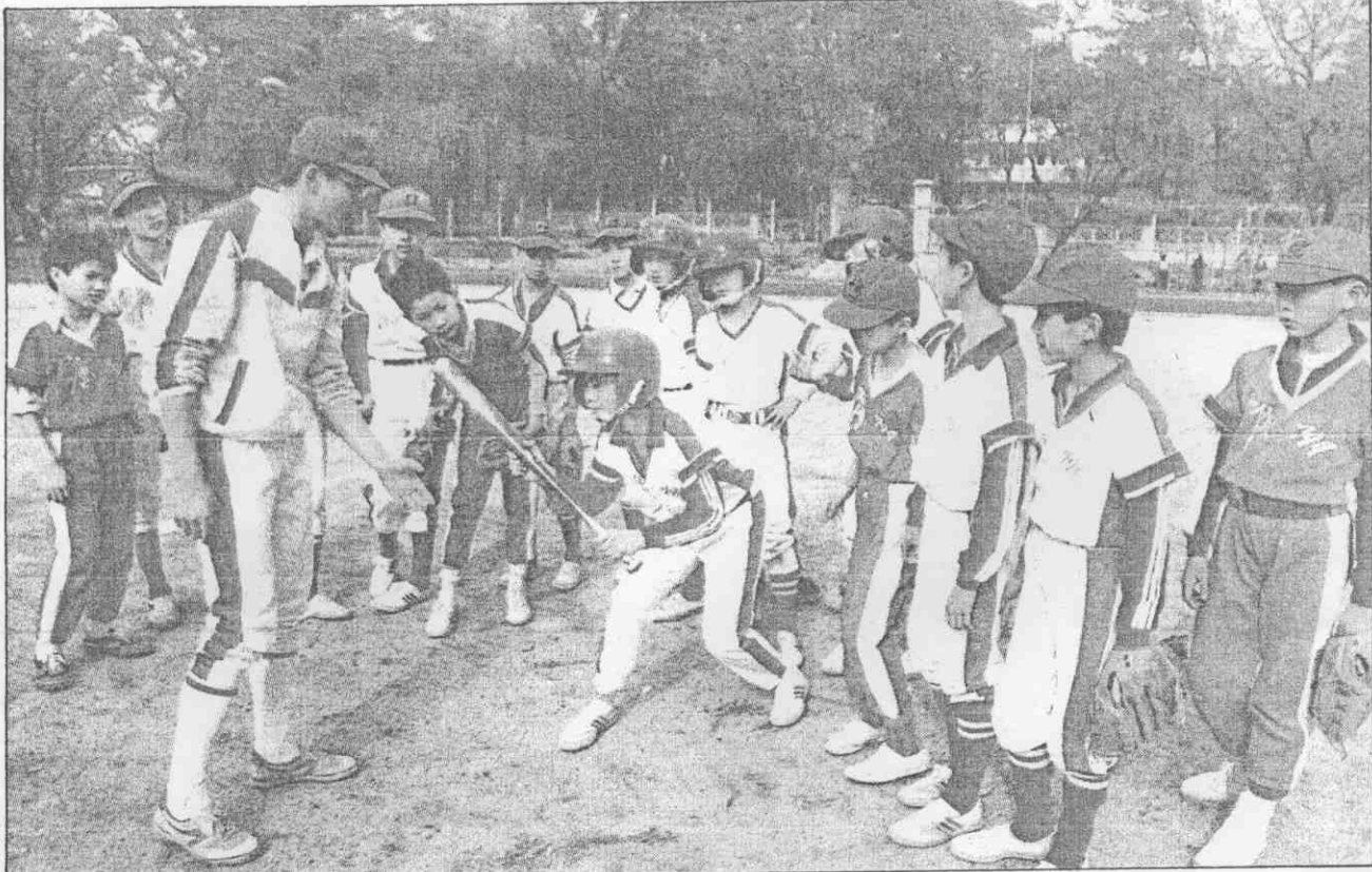
▶廣州師範學院附屬小學棒球隊，取得廣州代表權，正在進行觸擊練習。

明年的亞運是一個國際體育盛會，大陸體育界對棒球是否列為亞運比賽項目猶豫再三，棒球是個熱門項目，連卡迪巴、籃球這些偏僻冷門運動都列入比賽，紅遍半邊天的棒球，不在亞運出現成嗎？ 大陸體委考慮的第一個因素是「自己球隊行嗎？」 「拿得到獎牌嗎？」 台灣寶島的實力一等一，屆時在北平豐台球場上大勝「中國隊」會不會很難堪？ 這些問題實在夠噁的！ 亞運組織委員會開了十多次會斟酌再三，棒球賽還是連「示範賽」都沾不到邊。 位於豐台運動區的棒、壘球場所有硬體設備將近完工，內野區有容納五、六千人的看台，全壘打線達一二〇公尺（中外野），汽車可以開到二樓貴賓區看台，但是明年亞運還是只有女壘沒有棒球的份。 以我們此刻心情來審視大陸棒球發展，實在複雜萬分，一方面我們希望大陸棒球趕緊茁壯，趕明年九月之前來得及將棒球列為亞運項目；出外比賽爭個好成績，也可以順便佐證中國人的確會打棒球。 另一方面，我們又得趕緊提昇自己力量，不要連被視為自由中國「國技」的棒球也打不過大陸，到那時才是笑話呢！ 本報記者 蘇嘉祥