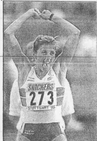
↑古妮兒在四百欄破世界紀錄，樂得大叫。