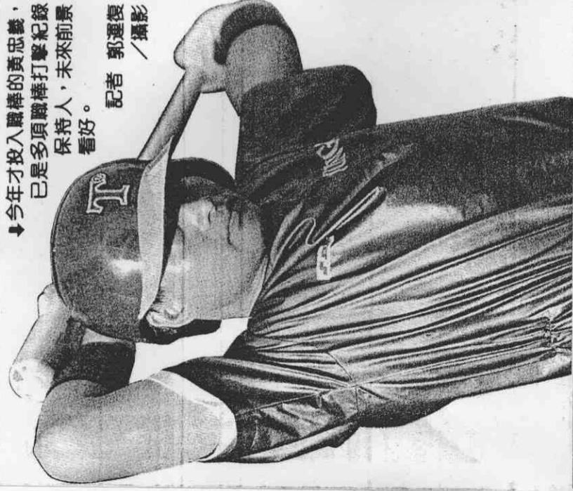
記者 王惠民 / 專題報導