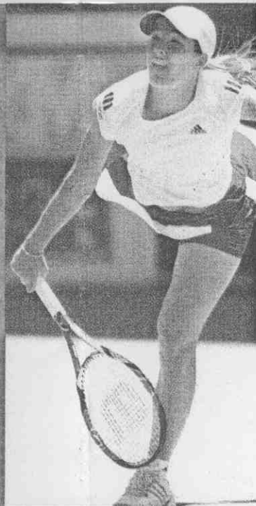
「失婚球后」漢妮去年因婚姻觸礁，澳網缺席，今年她希望能延續去年好手氣，開季就抱回好成績。

托威斯基昨全場發出14記愛司球，卻繳出41次非受迫性失誤，成為落敗最大關鍵，球風穩健的納達爾全場雖多半落居被動，但靠著高度穩定性總能挺過難關，加上托威斯基決勝階段失誤過多自毀長城，未能爆冷拉下強敵納達爾。