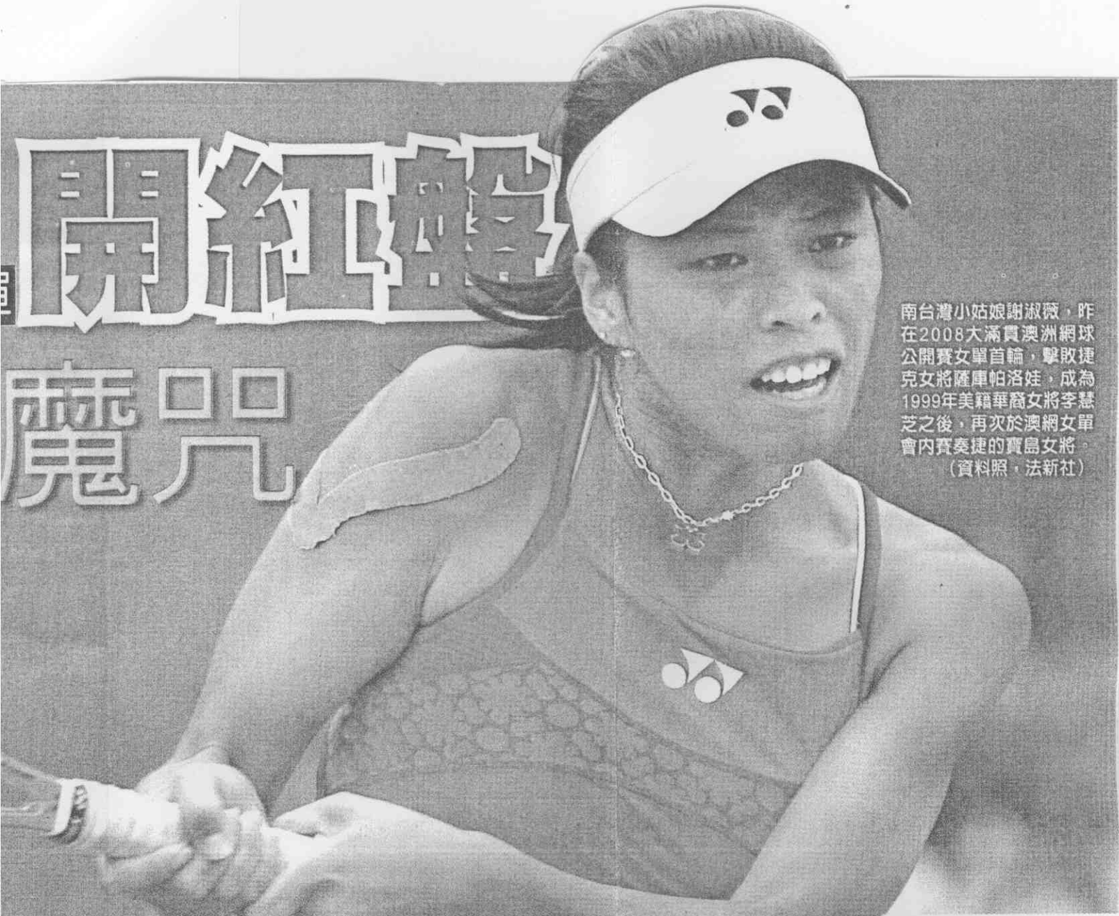
南台灣小姑娘謝淑薇，昨在2008大滿貫澳洲網球公開賽女單首輪，擊敗捷克女將薩庫帕洛娃，成為1999年美籍華裔女將李慧芝之後，再次於澳網女單會內賽奏捷的寶島女將。