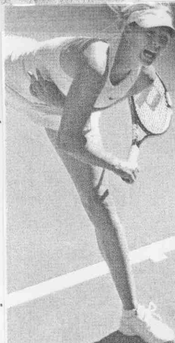
俄羅斯美少女莎拉波娃，昨在2008大滿貫首輪展現威猛發球實力，靠著強勁發球做後盾，輕鬆闖過頭關。