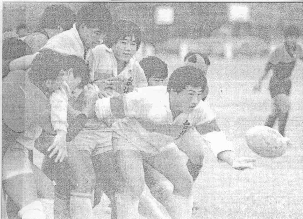
。隊市北台給輸點差，勝求中險市南台，烈激爭競賽球欖橄↑