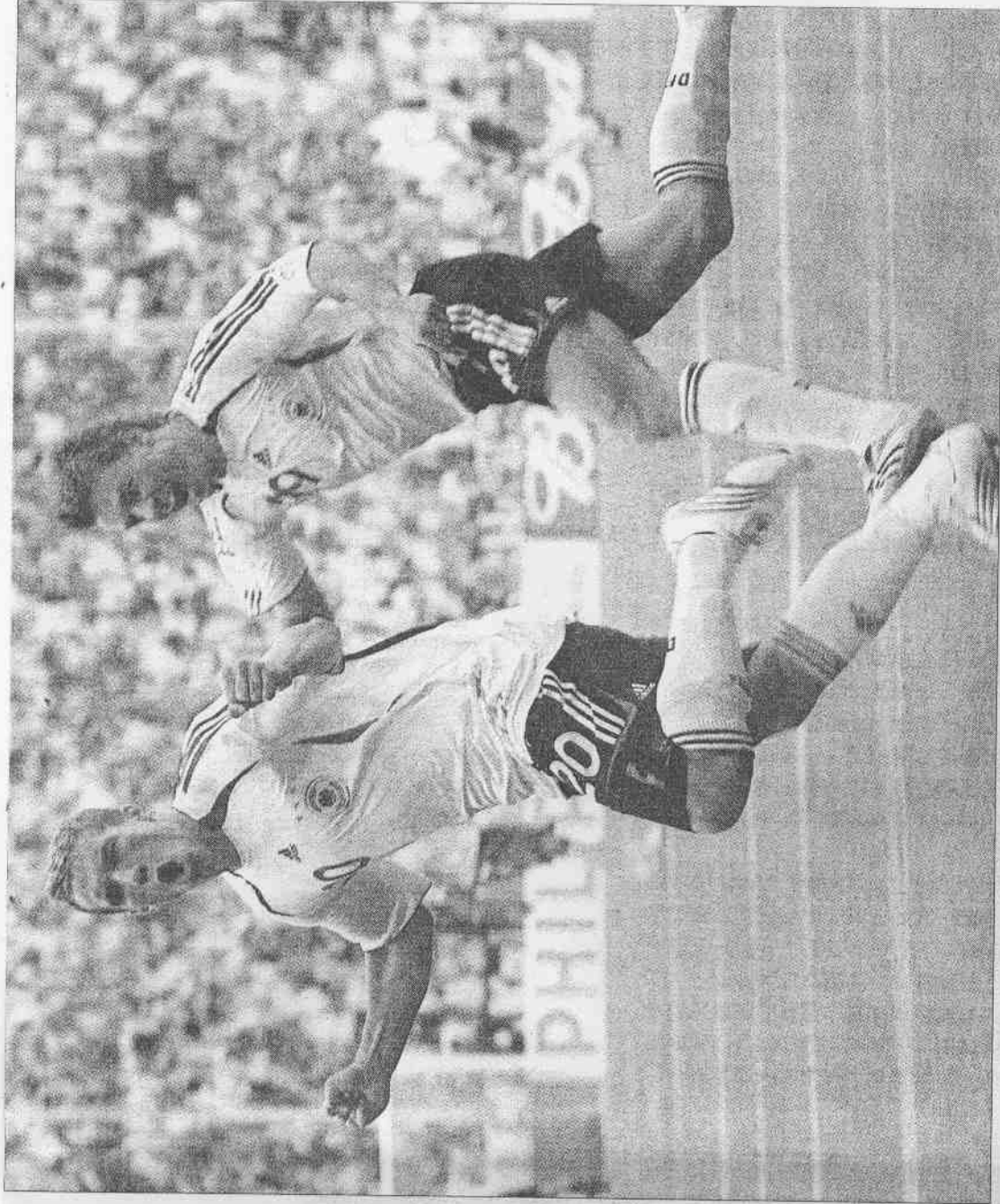
▲德國前鋒波多斯基(左)對瑞典十六強賽上半場一開賽就連進兩球，讓德國一路領先到終場。