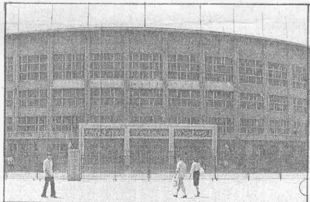
門深鎖，一般人難登大堂。下圖：網球中心有室外、室內球場，但是在北平幾乎找不到幾位打網球的一般民眾。

寫到這裡，我想起當前國內一些企業和廠家紛紛與專業運動隊搞起了「合辦」或稱「橫向聯合」。有關部門謂之「社會辦體育」，說這是改革。實際上，只不過是這些廠家每年拿出多少錢來給了運動隊，這些運動隊則在比賽時使用這個廠家的名字罷了。於是，不少原先的省、市隊，現在改為這個是電冰箱隊，那個是高壓鍋隊，以各種紡織、輕工業品命名的運動隊你方唱罷我登場，紛紛亮相。至於這個廠家的職工體育活動和健康，並不管受益。廠