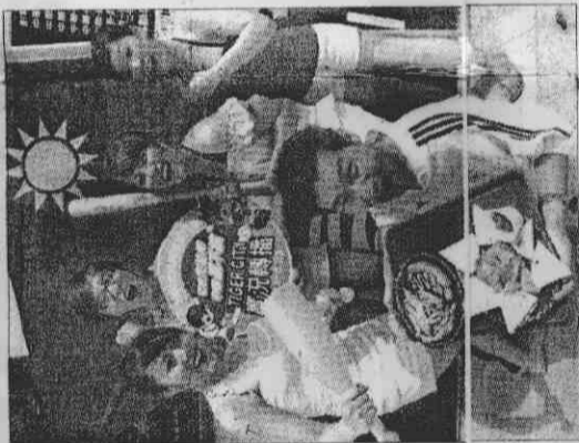
▲奧運棒球比賽13日開打，TIGER CITY廣場邀請您一起到廣場看大壘賽實況轉播。

美國隊「陪公子練兵」的熱情，讓中國隊深刻感受了，連布希總統都蒞臨練習賽，熱烈捧場中、美兩國的棒球隊。