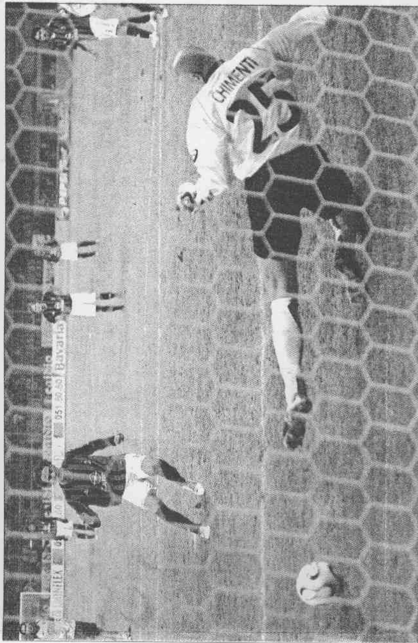
▲12碼罰球可以說是足球比賽的極刑，挨打一方死裡逃生機會不高。