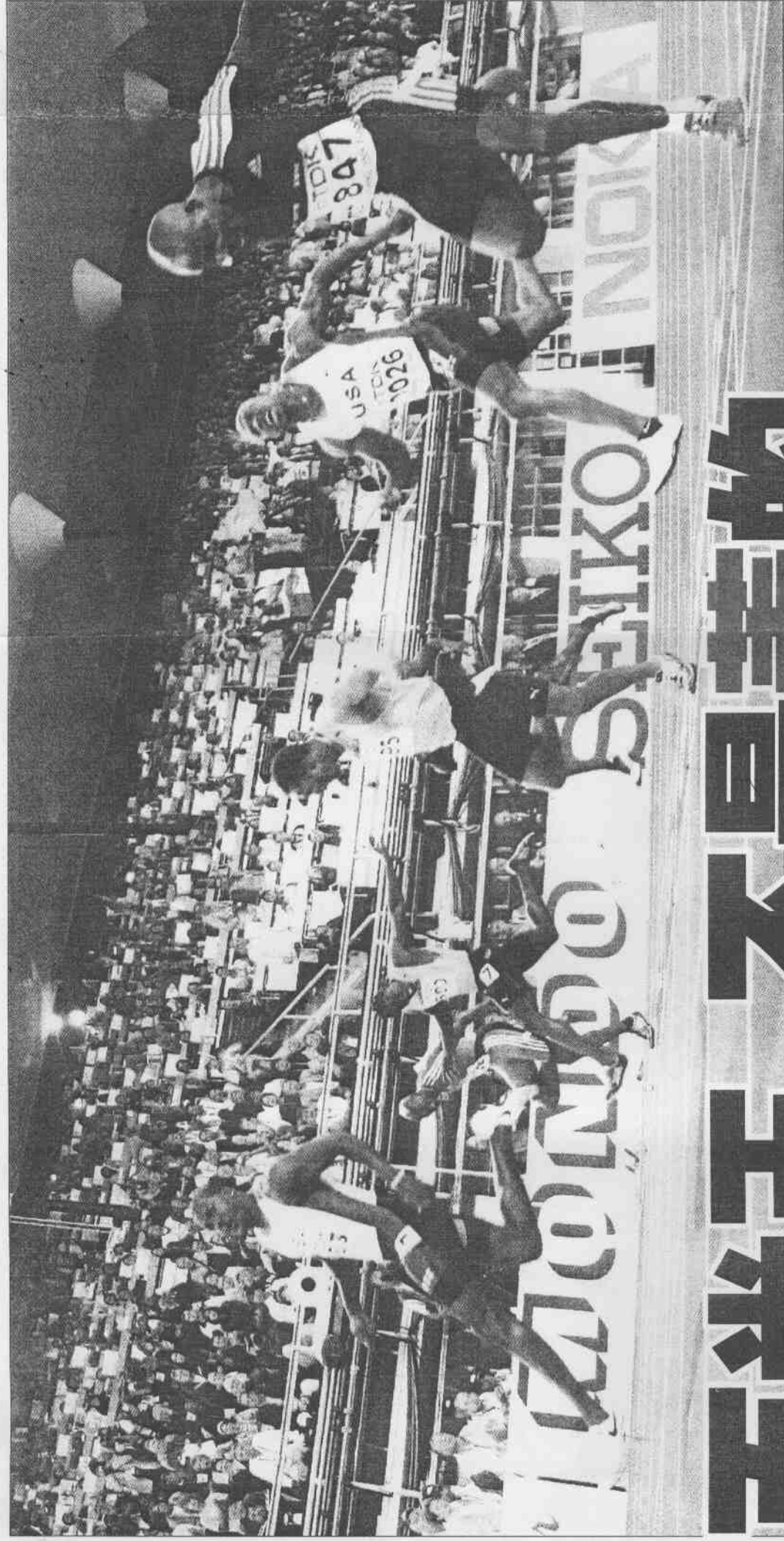
▲美國的奧運金牌選手蓋特林(左前)昨天在世田賽領先一大步率先衝過終點，以9秒88贏得百公尺金牌。