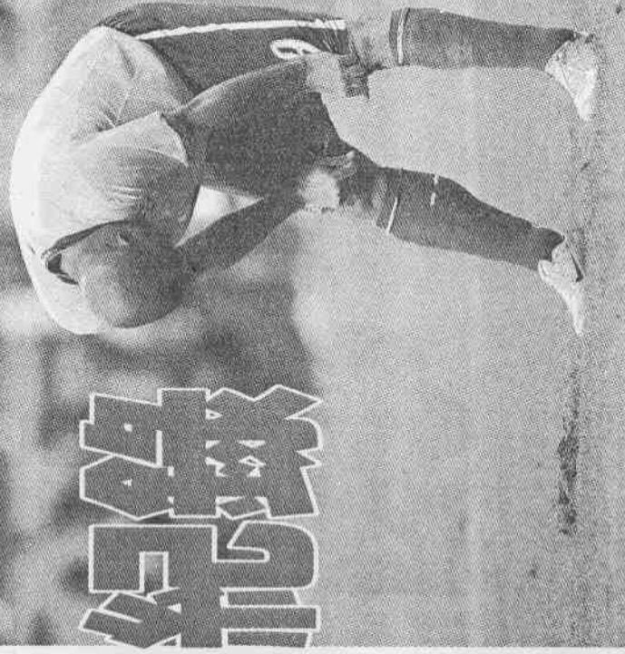
▲羅納度面對法軍毫無建樹，比賽結束後頹喪低頭。