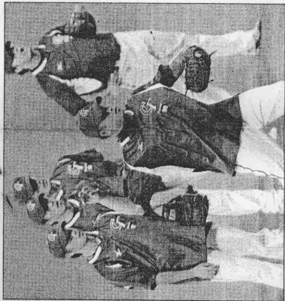
↑台灣隊棒球選手昨晚到五棵松棒球場練球，球員適應得不錯。

不過，面對這樣的賽程安排，若對日本戰況激烈，動用過多投手，仍可能影響隔天對中國之戰的牛棚戰力，這也是教練團進行沙盘推演中，已經注意到的「變數」。