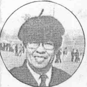
北京麗都飯店董事