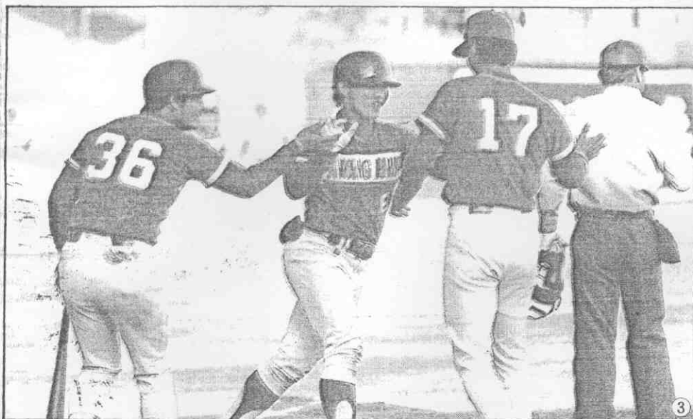
●望希的隊本日敗擊是，秋仲林③的佳最現表擊打上加，信義陳②、成建郭手投力主佳最況近①