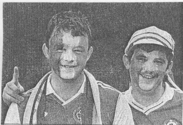
↑這是一眼就看得出忠誠度的愛爾蘭球迷。