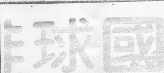
↑中華藍演出精采，北一女同學看得忘我。 ←中華白隊扣殺，南韓⑮奇龍一(右起)、⑪金貞槿封阻不及。