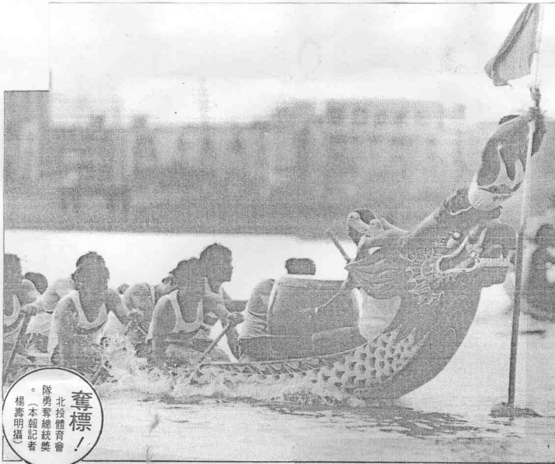
奪標！ 北投體育會 隊勇奪總統獎 。