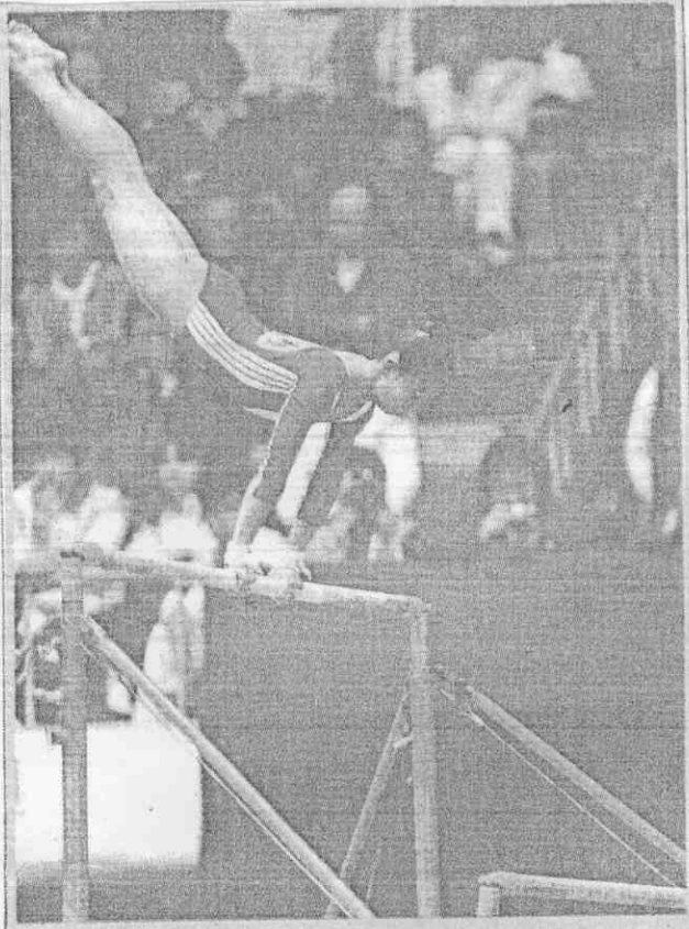
開：右。作動妙美的立倒上槓低高在，達蓮尤手選國美：上 。舞環的出演生學大師由目節演表幕