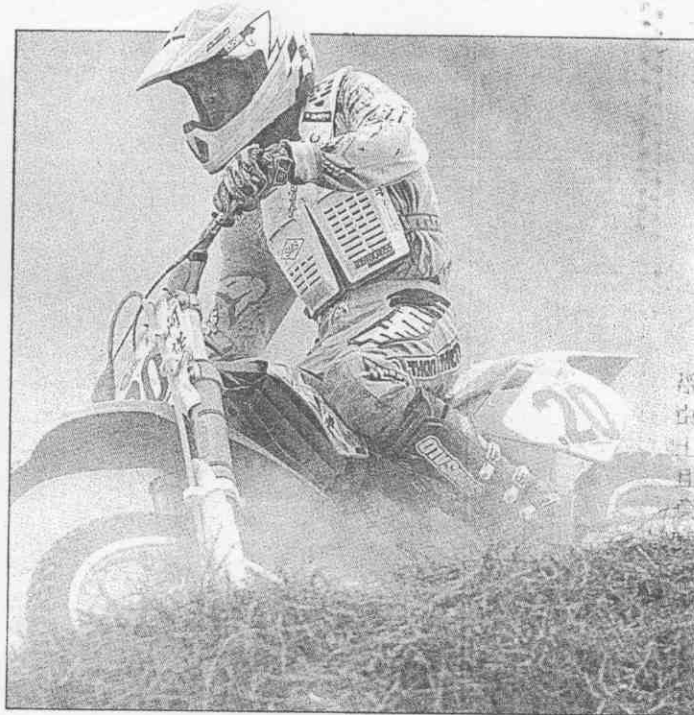
↑選手穿著安全裝備在炎熱的陽光下競賽。