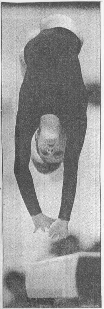
↑不愧是奧運平衡木金牌選手，烏克蘭古蘇昨在中華汽車杯賽平衡木決賽展現實力拿下金牌。